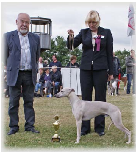
Jüngsten Best in Show 2009

am 10. und 11. Juli 2010 in Köln-Deckstein