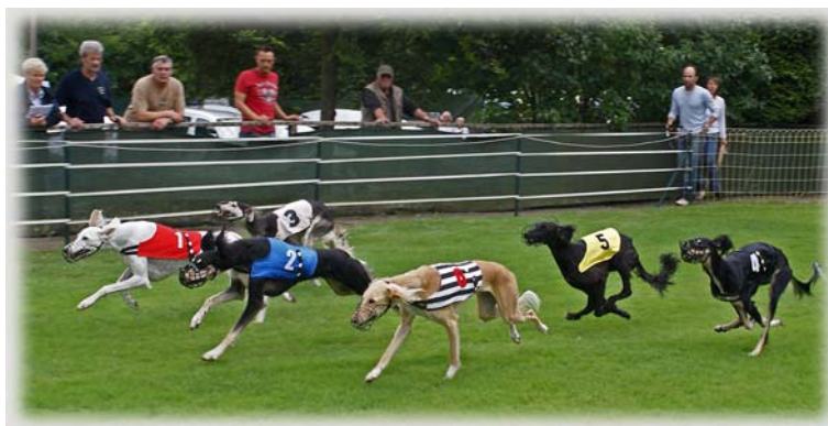
Endlauf der Saluki-Hündinnen (2009)